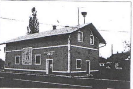
Prostovoljno gasilsko društvo Biš bo prihodnje leto praznovalo 125 let delovanja